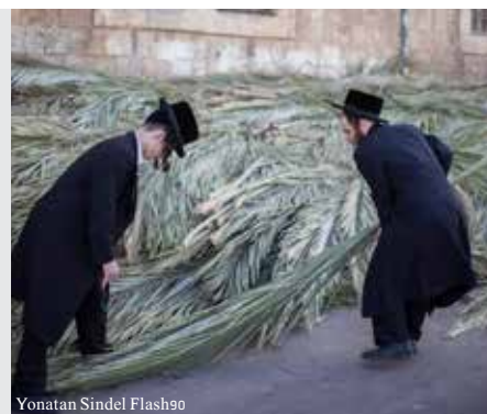
Yonatan Sindel Flash90