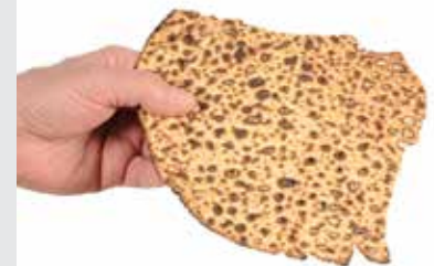
סוכה דף מו