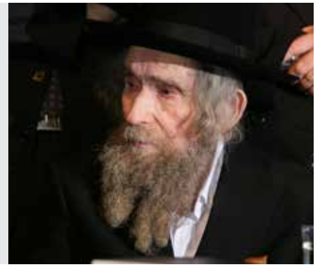
סוכה דף נו