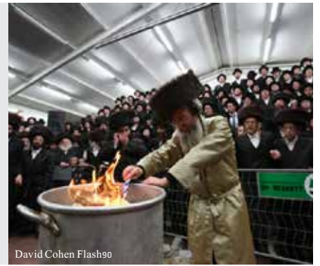
David Cohen Flash90