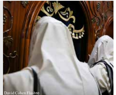
David Cohen Flash90

חברו לעבודה שיושב על ידו, תחב לידו ספר תהילים: "תגיד כמה פרקי תהילים, תתפלל על פרנסה, אולי זה יעזור במקום הסגולה שפספסת..."