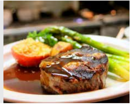
פסחים דף ככא