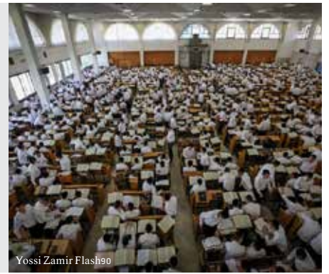
Yossi Zamir Flashoo