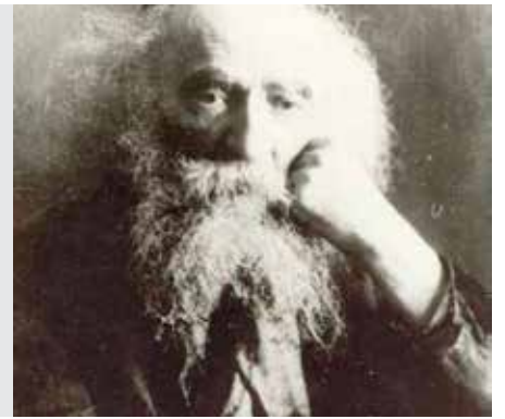
יומא דף לב