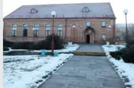
יומא דף נט