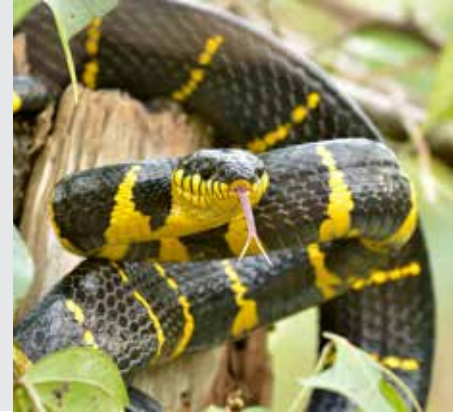
עירובין דף סג

"לא מתו בני אהרן עד שהורו הלכה בפני משה רבן"