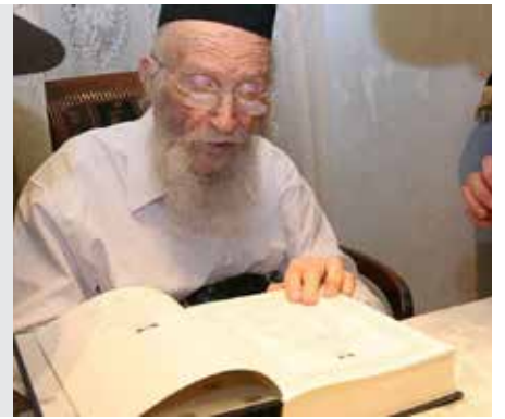
מועד קטן דף כא