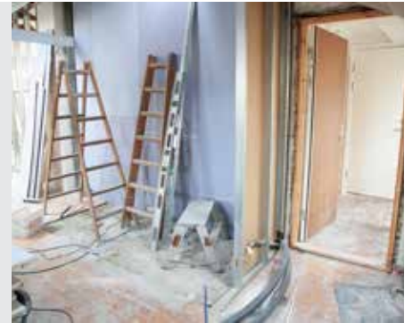
חגיגה דף ה