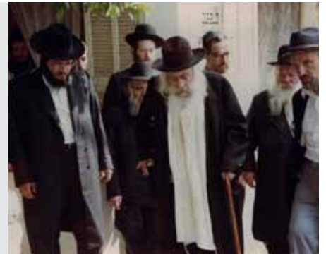
חגיגה דף 1