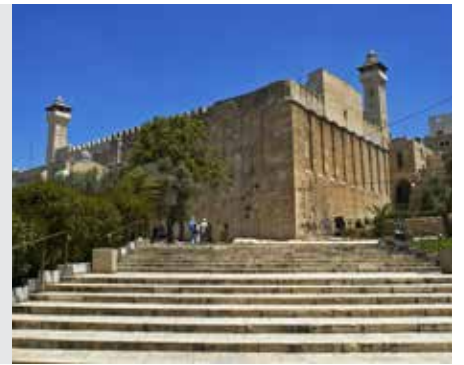
חגיגה דף יח