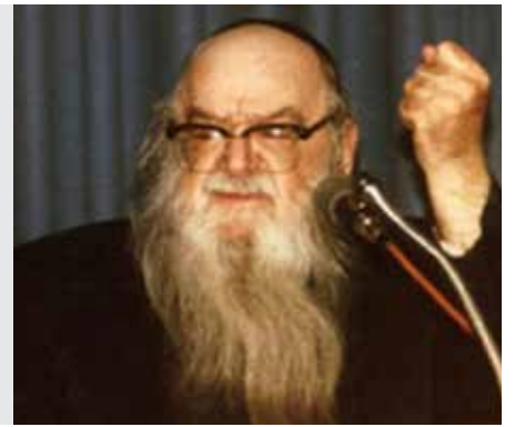
מועד קטן דף כה