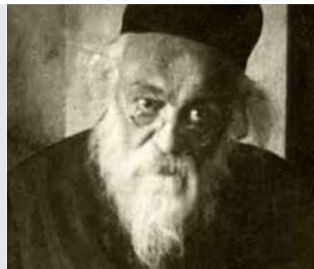
מועד קטן דף כח