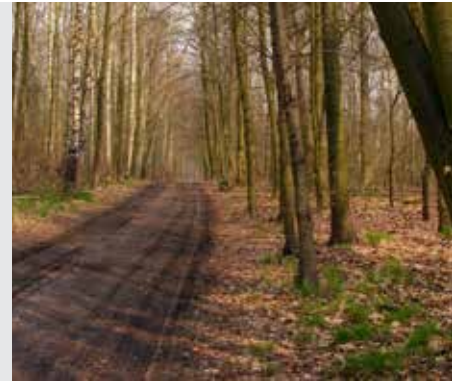
יבמות דף ו