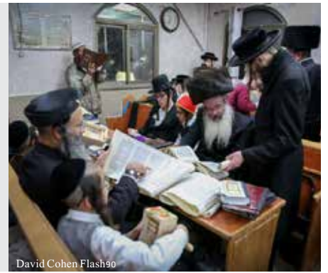
David Cohen Flash90