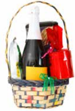
יבמות דף ה