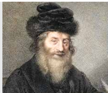
יבמות דף כב