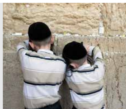
יבמות דף ג