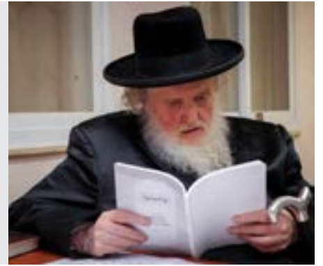
כתובות דף לו