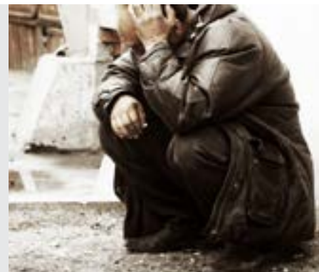
כתובות דף מ