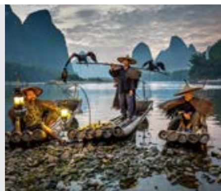
כתובות דף מג