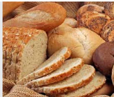
כתובות דף מז