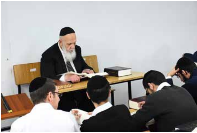
בשיעור יומי בישיבה.

מכתבם של מרן ראש הישיבה חכם שלום כהן זצ"ל והגאון רבי שבתאי אטון זצ"ל.