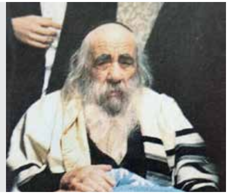
כתובות דף כח