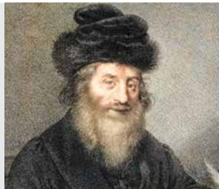
ביצה דף מ