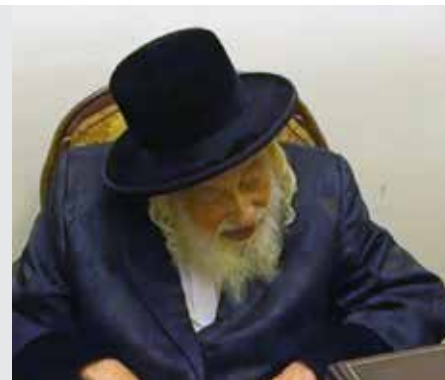
כתובות דף עא