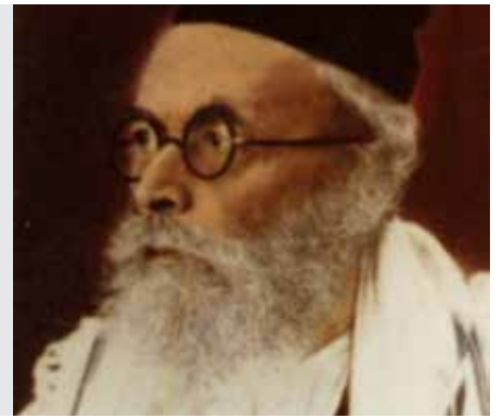
כתובות דף עד