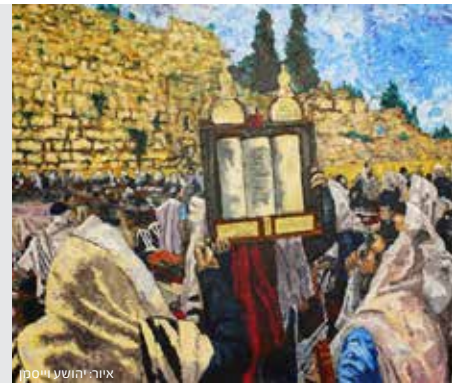
כתובות דף פא