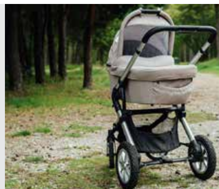
כתובות דף נה

בעל שכתב צוואה לאשתו מעוברת, שאם תלד בן יחולקו הנכסים באופן מסויים, ואם תלד בת יחולקו הנכסים באופן אחר - ונולדו תאומים!