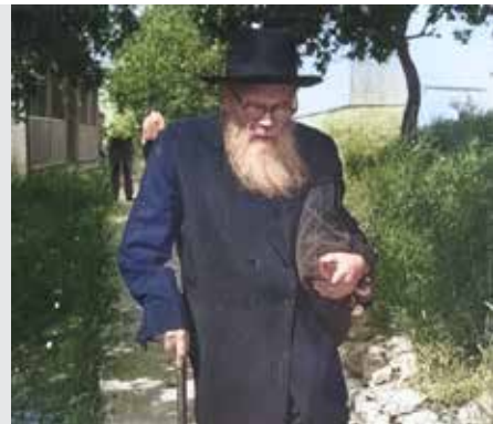
כתובות דף נז