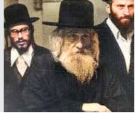
"אם בחוקתי תלכו!"