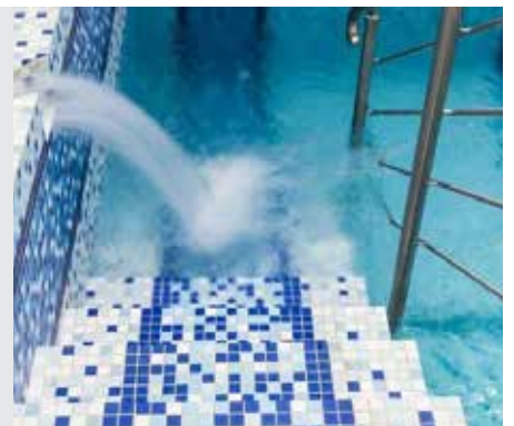
יבמות דף עא