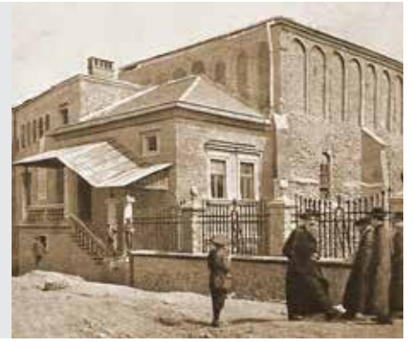
יבמות דף פד