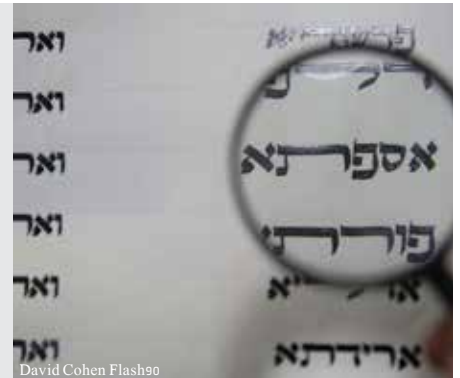
David Cohen Flash90