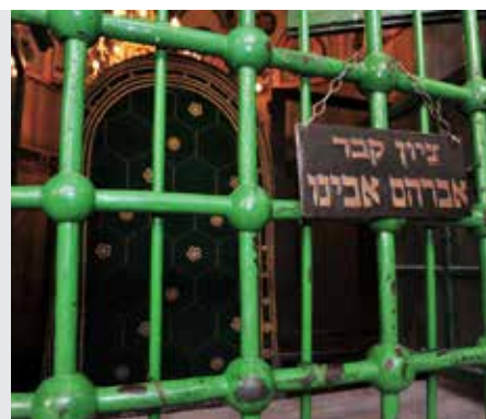
יבמות דף סד