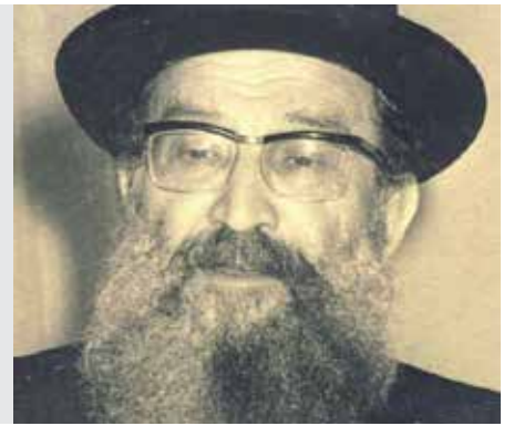
תענית דף י