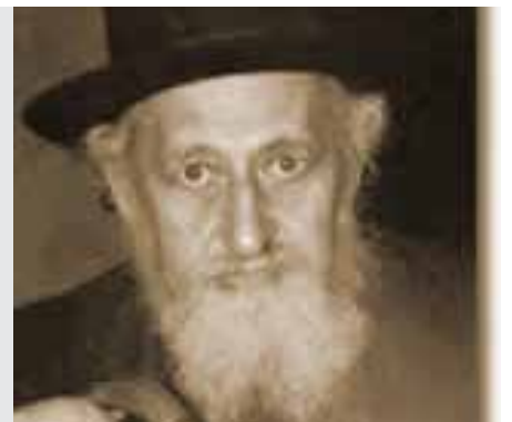
יבמות דף נה