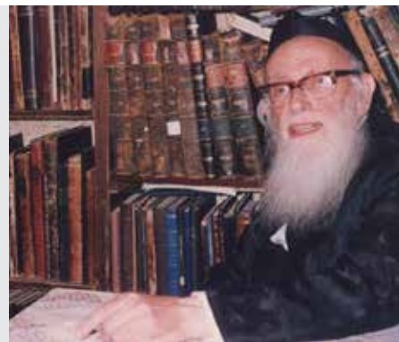
מועד קטן דף יב