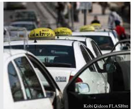
Kobi Gideon FLASH90