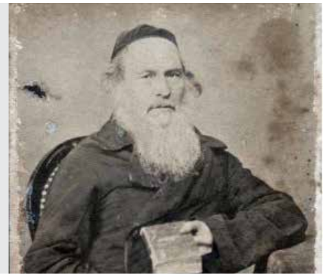
ואלה המשפטים (שמות כא א)

הפרוטה האחרונה, ולא גילה דבר לאיש. רק לאשתו הרבנית אמר שתשים עין מהיום והלאה על המשרתת. עברו כמה חודשים ובפרוס ערב פסח כשניקה ובדק ספריו, נפלה מעטפת הפיקדון מהספר. הוא נזכר במעשה, ובמקום להתמלא שמחה כי הושב כספו שאבד לו, בא לידי צער עמוק על שהרהר בלבו חשד שווא על בת ישראל כשרה, אף שלא אמר לה דבר וחצי דבר על כך. הוא קרא לה, ובככי גדול סיפר לה את כל העניין, פייסה וביקש ממנה מחילה. ולא נתקררה דעתו של אותו צדיק עד שאמר כי לאות פיוס הוא מוכן לתת לה מה שתבחר מחפציו בבית.