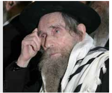
יבמות דף קטו