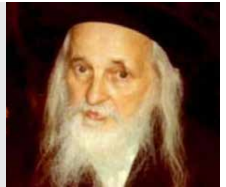
כתובות דף ו