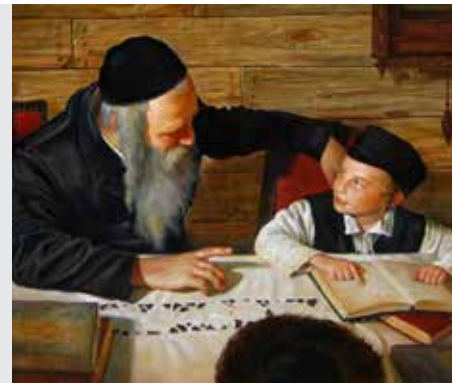
כתובות דף טו