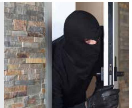
יבמות דף קיח