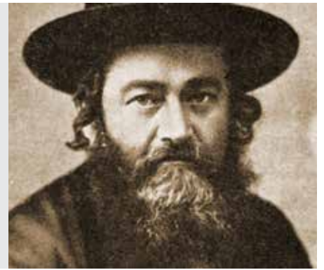
יבמות דף קכב