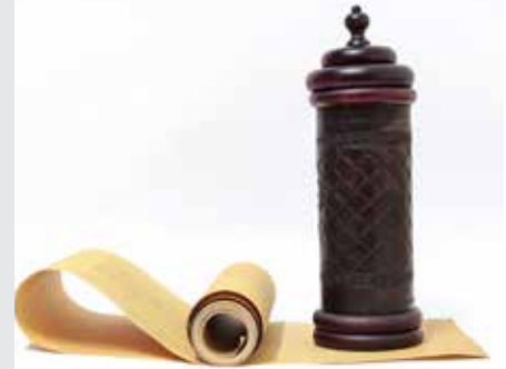
מגילה דף ד