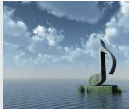
מגילה דף י