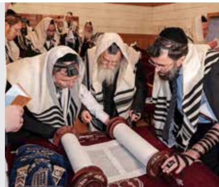
מגילה דף כא