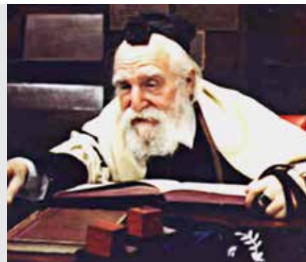
ביצה דף ל