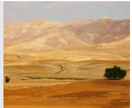
ביצה דף יג