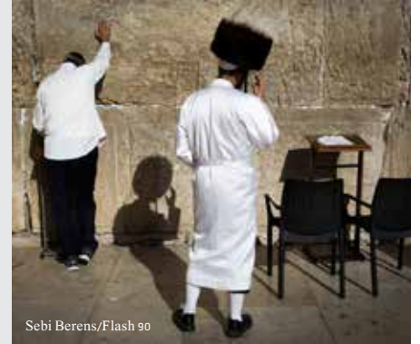
Sebi Berens/Flash 90

מים על גופו. וכתבו הפוסקים, ששפיכת תשעה קבין נחשבת כטבילה לצורך קיום 'תקנת עזרא' לטבילה מטומאה, אבל אינה נחשבת כטבילה לשם תשובה; ובדומה לכך, טבילה במים שאובים, שמועילה לשם תקנת עזרא, אינה נחשבת כטבילה לשם תשובה. ויש אומרים שאף שפיכת תשעה קבין מועילה כטבילה לשם תשובה.